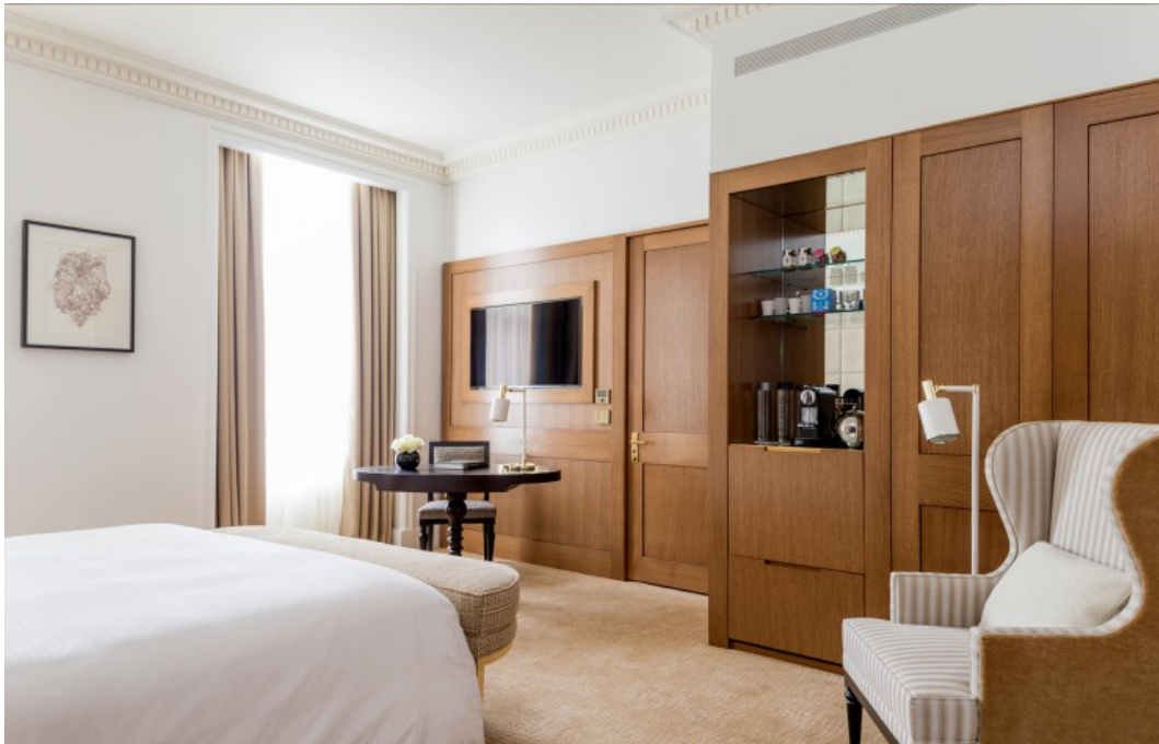
Room Deluxe et ses boiseries chaleureuses. Four Seasons

Des références qui se retrouvent aussi dans les 89 chambres et les 11 suites de l'hôtel, aménagées sur les trois premiers étages de l'édifice. Les chambres ont été pensées comme des cabines de bateau où le bois et les teintes choisies rendent l'atmosphère intime et confortable.