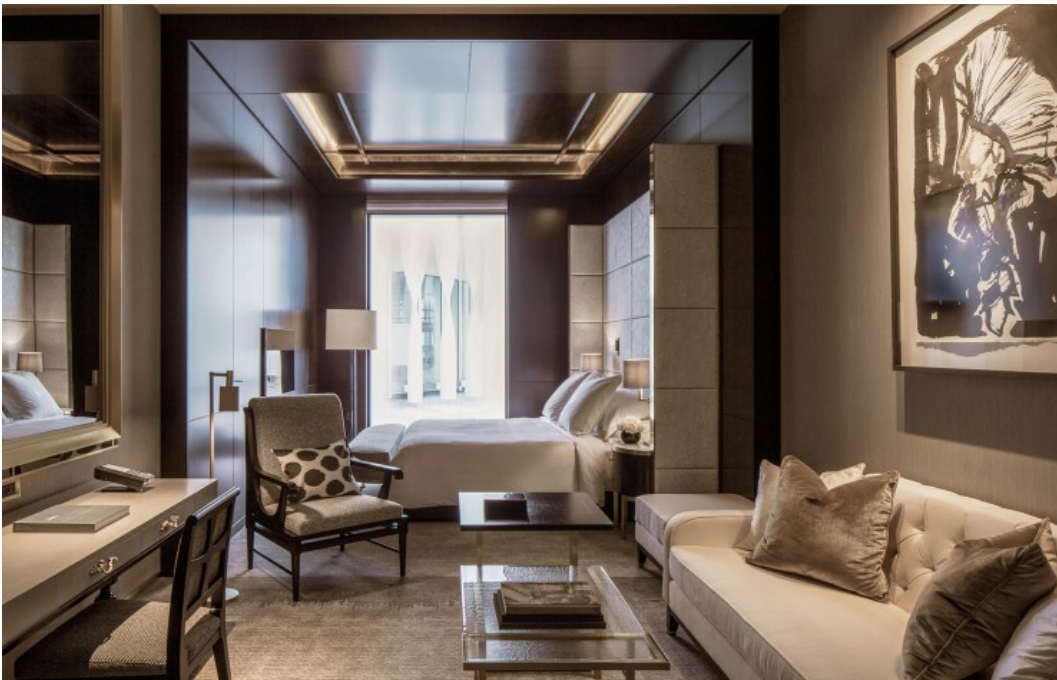
Une Executive Room, avec son coin salon et la vue sur cour intérieure. Four Seasons

Pour ce nouveau Four Seasons, ils ont refait vivre la richesse de l'Empire dont les marchandises qui arrivaient d'Orient et d'Occident par la Tamise étaient répertoriées dans ces murs. L'hôtel s'articule autour du Lobby qui multiplie les références aux navires avec sa coupole, ses décorations murales et ses colonnes torsadées.