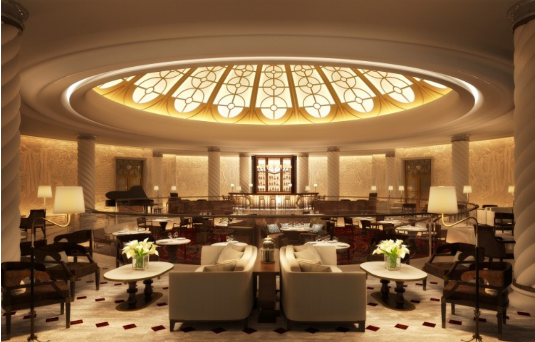
Une autre vue du lobby de l'hôtel et sa coupole.