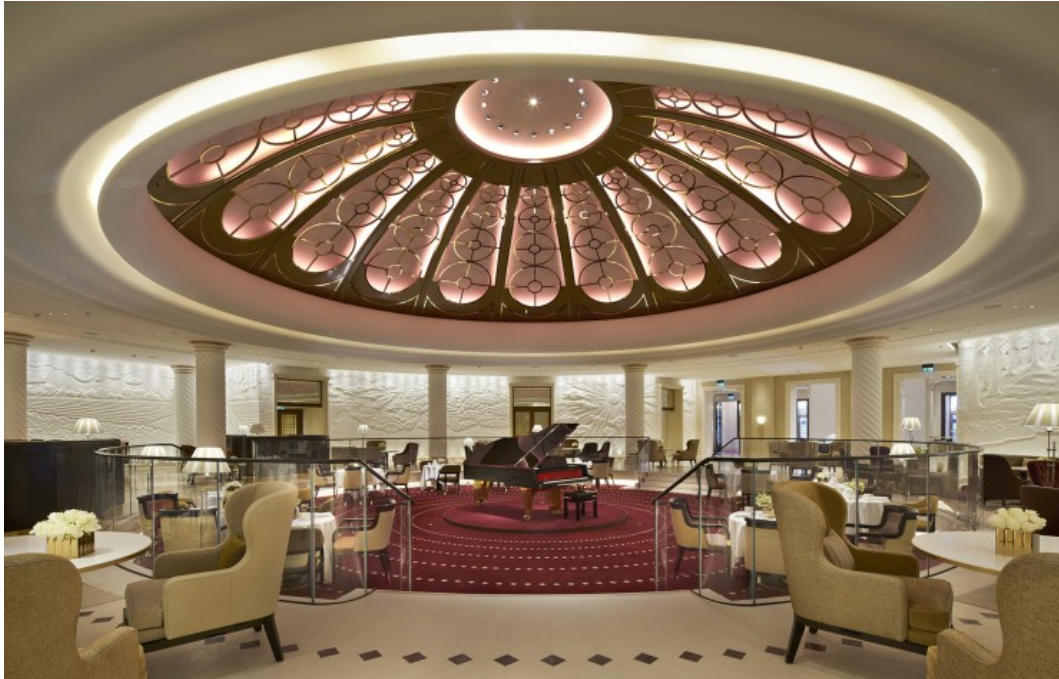
Le lobby de l'hôtel sous la coupole magnifique du Ten Trinity Square. Four Seasons

Loin de Mayfair où se concentrent les adresses les plus prestigieuses de Londres, le groupe Four Seasons a choisi d'installer son nouveau bastion, en plein cœur de la City et plus précisément dans le très emblématique Ten Trinity Square. Édifié en 1922 pour accueillir les Autorités Portuaires de la ville, il est aujourd'hui classé monument historique et bénéficie d'un emplacement privilégié. On retrouve d'un côté le Tower Bridge surplombant la Tamise et la Tour de Londres et de l'autre les bureaux de Norman Foster et Richard Rogers. L'hôtel est le premier de ce genre à s'installer dans l'Est de la ville qui connaît aujourd'hui un vrai renouveau. Un adresse qui actualise l'offre hôtelière de la ville en s'adressant aussi bien à une clientèle d'affaire qu'aux visiteurs de la capitale britannique.