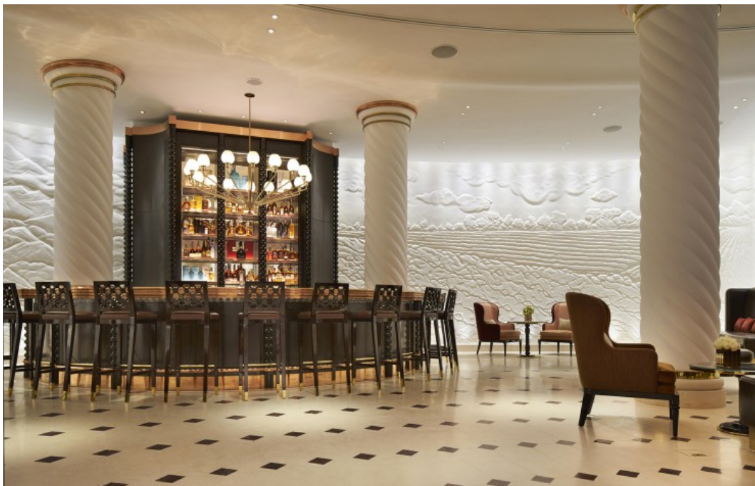
Le Rotunda Bar au centre de l'hôtel.

Loin de Mayfair où se concentrent les adresses les plus prestigieuses de Londres, le groupe a choisi d'installer son nouveau bastion, en plein cœur de la City et plus précisément dans le très emblématique Ten Trinity Square. Édifié en 1922 pour accueillir les Autorités Portuaires de la ville, il est aujourd'hui classé monument historique et bénéficie d'un emplacement privilégié. On retrouve d'un côté le Tower Bridge surplombant la Tamise et la Tour de Londres et de l'autre les bureaux de Norman Foster et Richard Rogers. L'hôtel est le premier de ce genre à s'installer dans l'Est de la ville qui connaît aujourd'hui un vrai renouveau. Un adresse qui actualise l'offre hôtelière de la ville en s'adressant aussi bien à une clientèle d'affaire qu'aux visiteurs de la capitale britannique.