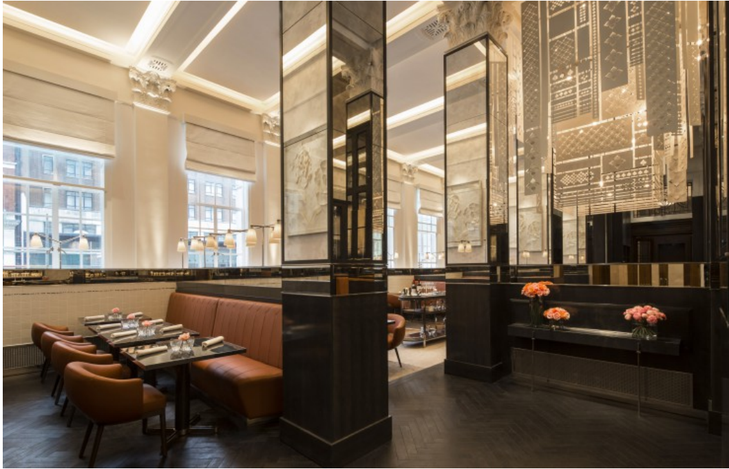
Le restaurant La Dame de Pic.

L'ouverture de cette nouvelle adresse a aussi été l'occasion de fêter l'arrivée à Londres de la seule femme triplement étoilée au Guide Michelin. Anne-Sophie Pic à désormais une adresse de l'autre côté de la Manche. Son restaurant la Dame de Pic (déjà une étoile à Paris) profite du cadre majestueux d'une partie classé du rez-de-chaussée de l'hôtel. Les architectes ont réussi à recréer un espace élégant et intimiste grâce à des jeux de miroirs et des éléments de décoration simples et chaleureux.