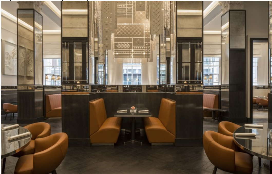
Des jeux de miroirs habillent le restaurant. Four Seasons

Un écrin où l'univers culinaire de la chef française se dévoile à travers une carte de saison. Anne-Sophie Pic mets son savoir faire au service du terroir britannique qu'elle relève grâce à des ingrédients venus des quatre coins du monde pour créer la palette aromatique unique dont elle a le secret.